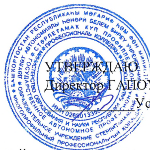
ГРАФИК ПРОМЕЖУТОЧНОЙ АТТЕСТАЦИИ группы БД-212 специальность 38.02.07 Банковское дело